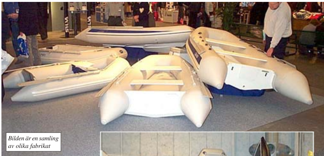
Bilden är en samling av olika fabrikat

Otter visades av Skanstulls Marintillbehör AB. Jag har ingen erfarenhet av dessa båtar men dom verkade ha bra kvaliteé till hyfsade priser – en MAS380 med fast durk kostade 13.400 kr på mässan.