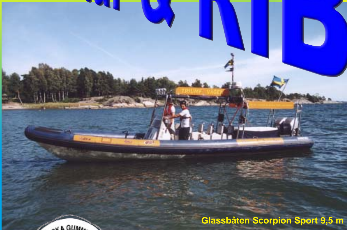
Glassbåten Scorpion Sport 9,5 m