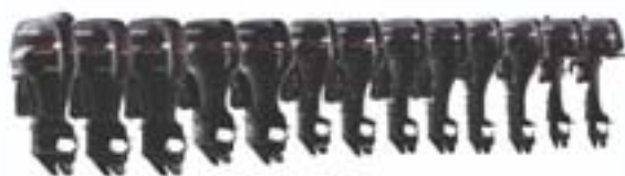
Bränsleinsprutning från följande modeller DF40 och uppåt

Titta in hos din handlare och bekanta dig med våra världsledande motorer!