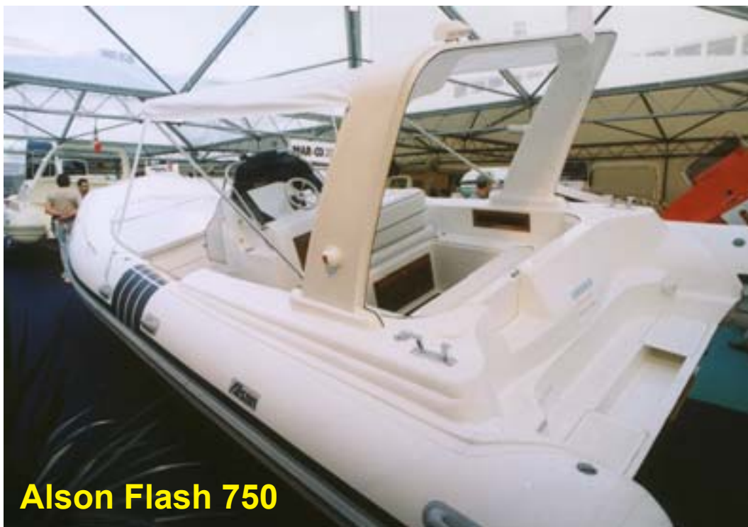
Alson Flash 750

Alson visade också mässans vackraste rib, den helt nya Charme 32. Med sina eleganta linjer och längd på knappt 10 m drog den många blickar.