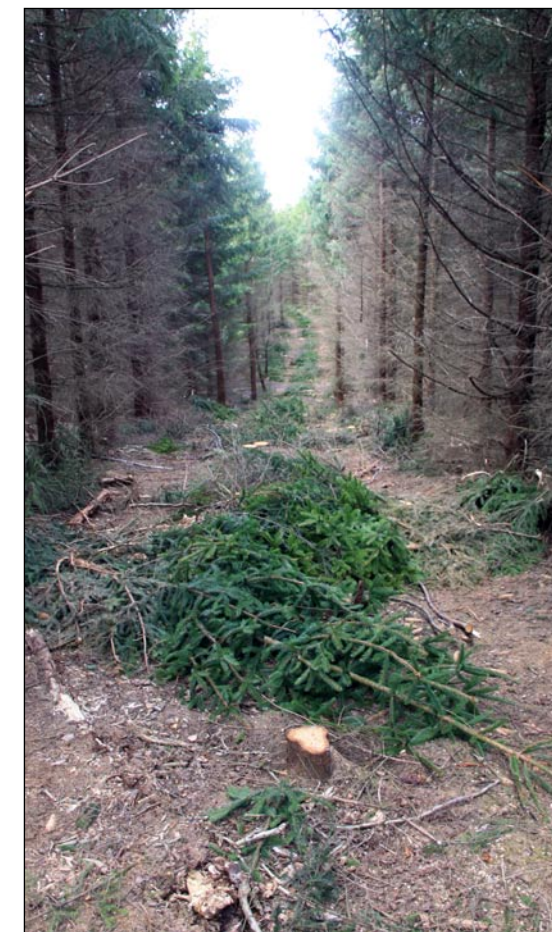
Utsikt från Galgebacken

Under denna väntan hade jag god tid att göra allvarsamma betraktelser. Jag försökte sätta mig in i kvinnans belägenhet och jag kände då mycket underligt inom mig... Somliga sa att hon var väl förberedd, andra