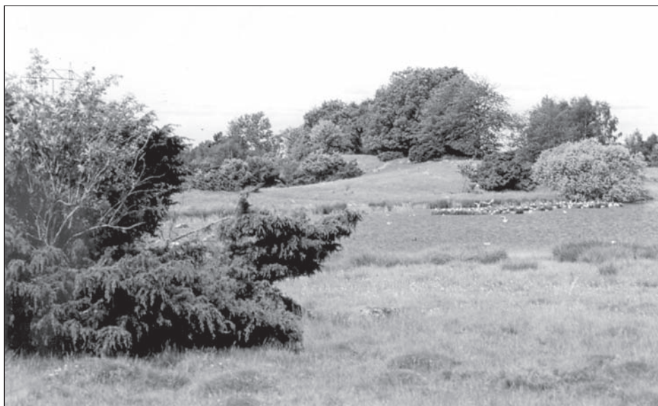
Hörby fålad med Lågedammarna. Här samlade Karna ene. På 1950-talet fanns här tre dammar, där den mittersta hade mest vatten. Vintertid körde man skridsko och under sommaren studerade man fågellivet. Det var skolungdomarnas paradiset.

Karna bryter upp och flyttar med sin son till Slagtofta nr 3. Prästen i Hörby noterar att Karna är född den 27 juli 1826. Hon har helt plötsligt blivit tre månader äldre och detta datum följer henne livet ut.