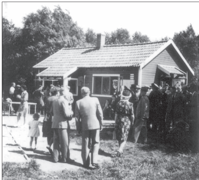
Klubbstugan vid skjutbanan i Slagtofta. Foto: Per-Gunnar Mörck, 1950-talet.

När Karna några dagar senare får se vad som är kvar av hennes torp brister hon ut i gråt. Men till sist förstår hon att man bara vill henne väl. Hon lever ytterligare tre år, och den 19 juli 1915 slutar hon sina dagar i en ålder av 88 år och 7 månader.