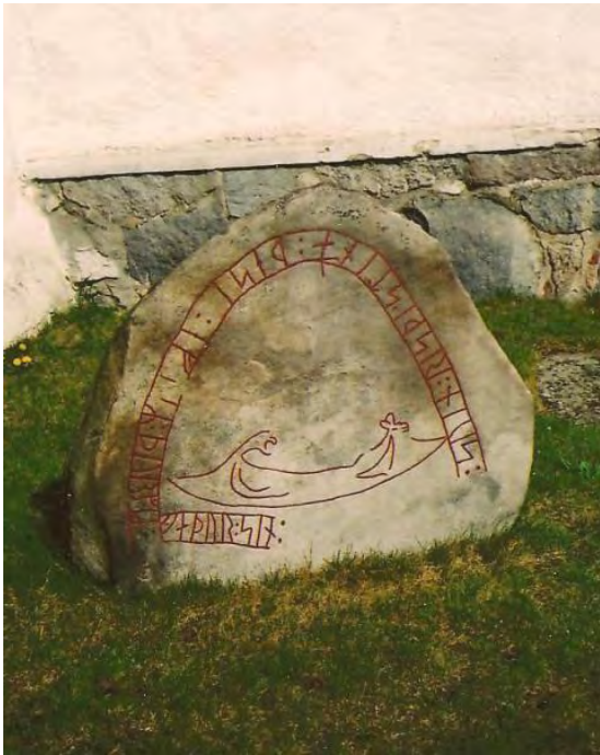
Runsten vid Holmby kyrka.

Invid kyrkan står en runsten med ett inhugget kors. Stenen hör till de stumma vittnesbörden om kristendomens framträngande i Skåne redan på 900-talet och följande århundrade. Den är från 1025 – 1050 och har inskriptionen: ”Sven reste denna sten efter Torger, sin fader”.