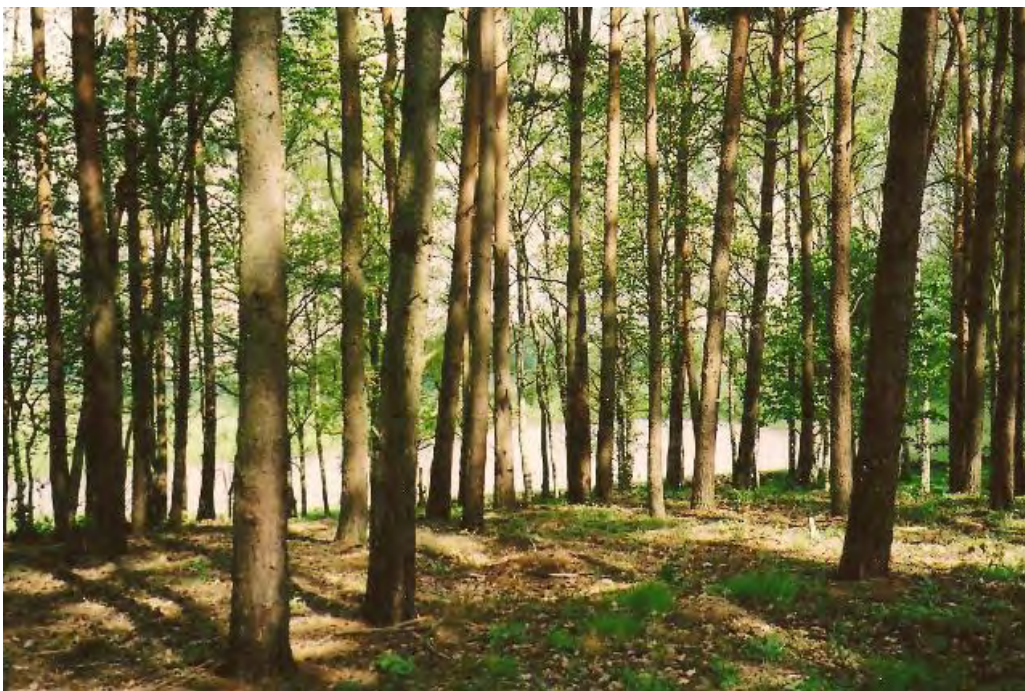
Holmby fure. Skogen ligger inne i byn och nära kyrkan.

I Holmby fanns det flygsand och många drabbades. Därför sådde man fure frö och sandhavre invid kyrkan både år 1791 och 1792. Träden står där än idag.