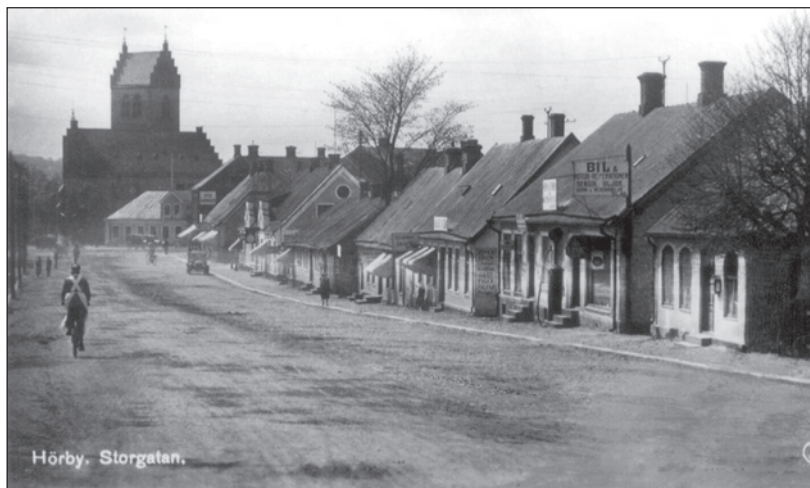
Barnmorska på uppdrag. Storgatan i Hörby på 1910-talet. En gata som både var gruslagd och stensatt om vartannat.