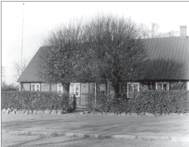
Huset på Kristianstadsvägen 44 på 1950-talet.

”Då man en sommardag färdas nedåt den väna Linderödsåsen, på stora landsvägen från Kristianstad och närmar sig Hörby köping, fånglas man av det storartade panorama man från höjderna har framför sig.