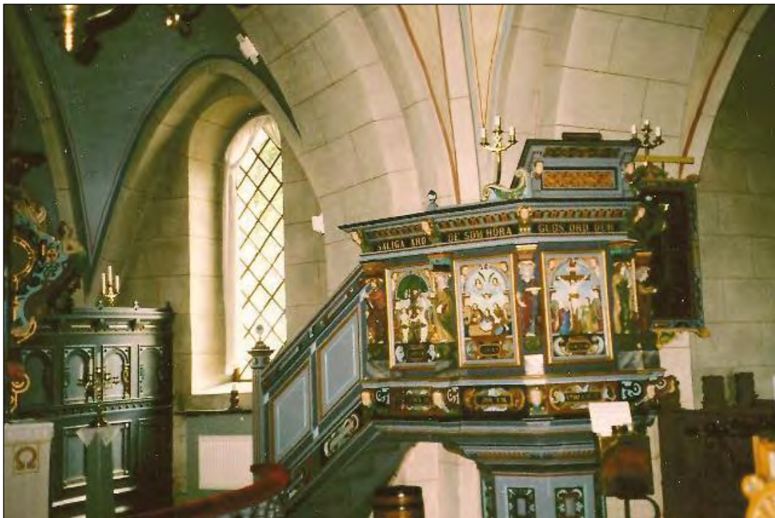
Lyby kyrka. Exteriör och interiör. Foto 2016.