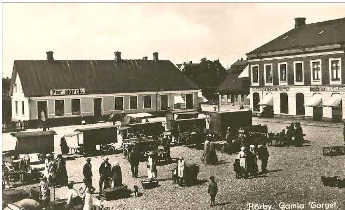
Torgdag på Gamla Torg i Hörby på 1910-talet. Vykort.

I en visa från ett kalas står bland annat: