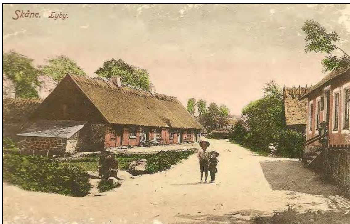
Statarlänga i Lyby som brann ner 1906. Vykort.