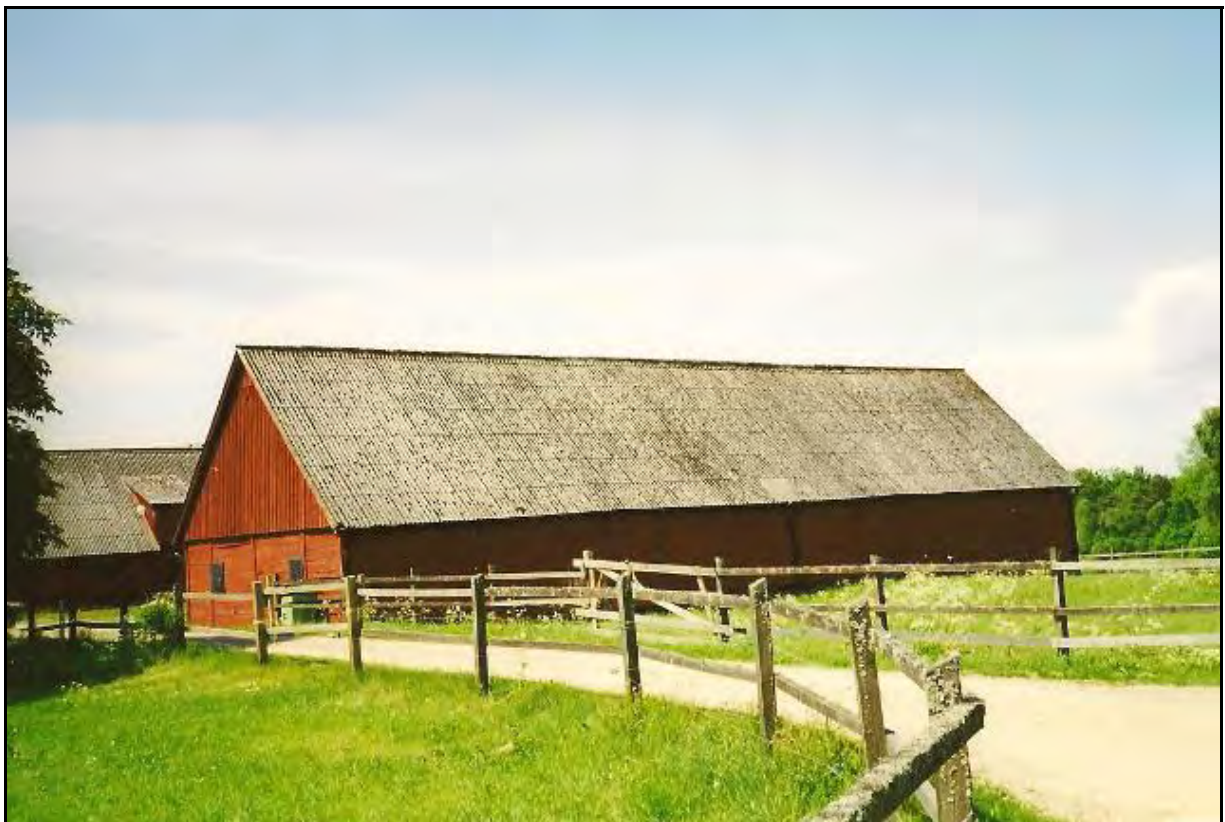
En av ladugårdarna till en gård i Toftaröd.