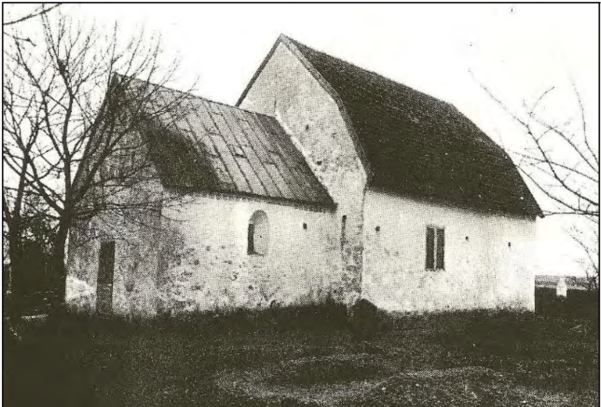
Remmarlövs gamla kyrka

Tystnaden är nästan total, det svaga suset bland de höga träden har upphört och skymningen gör sig alltmer märkbar. Jag står på en liten kyrkogård i mellanskåne, där många av mina förfäder ligger begravna. Här fanns fordom en kyrka, en av de minsta i Lunds stift. Församlingen växte och det pockades på en ny och större kyrka. Denna byggdes några stenkast från den gamla kyrkan, som förföll och senare revs. Idag kan man se var den legat då man markerat kyrkans yttermurar med en grusgång, men många av de gamla gravarna med deras stenar är borta för alltid.