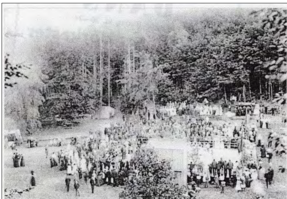
Ett av de första foton från Rövarekulans tivoli taget den 3 augusti 1902 vid Löberöds Skytteförenings basar.