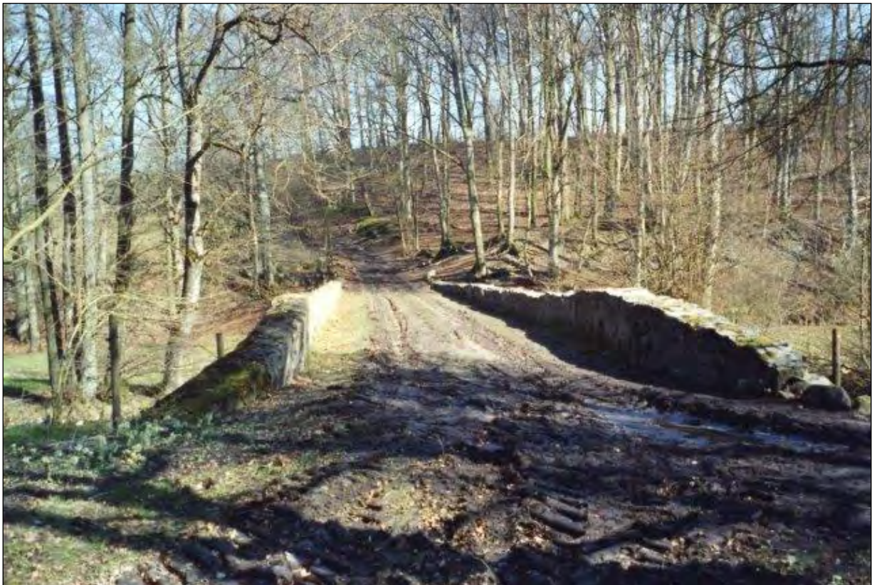
Gammal bro över Bråån.

Mitt i området finns en mäktig stenvalvsbro över Bråån som minne av den tid då landsvägen löpte genom dalgången.