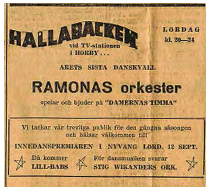
Annons för Hallabacken 1959.

I dungen vid entrén står redan många olåsta cyklar i ordning. Där ställer även töserna sina, om plats finns. I annat fall utnyttjas gräsytan mitt emot entrén, över vägen. I kön till entrékiosken blickar töserna förväntansfullt ut över området. Närmast till höger väntar kaffeludan med servering och godisförsäljning. Bortom ligger själva dansbanan som omges av ett trästaket med många kulörta lampor som