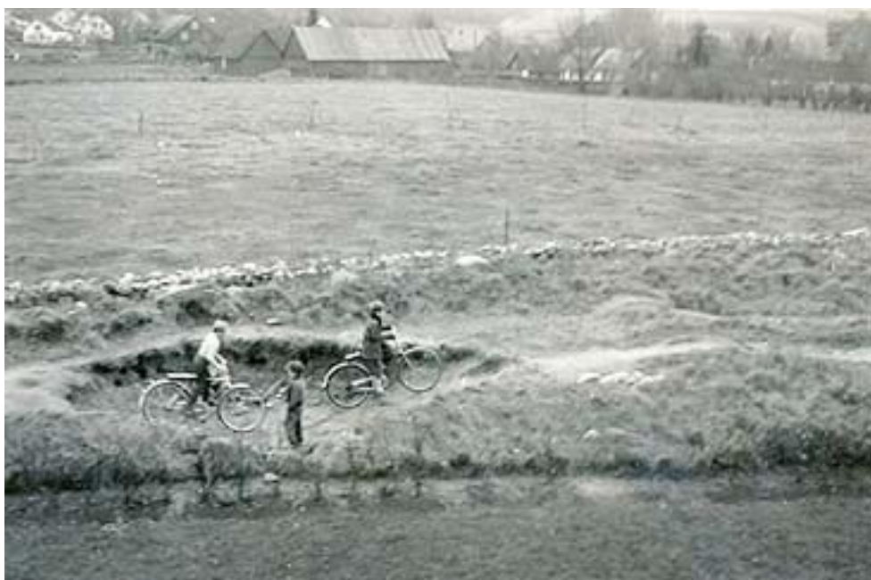
Ängen bakom Hörbyhus, och cykelcrossbanan, som barnen gävt ut i Normans land.

En annan gång, (jag var nog ännu inte i skolan), kom en grannpojke, som vi bara kände lite grann, helt upphetsad. Han hade hört att det var en auktion på gång nere på Söder, och om man gick dit fick man fri glass! Det lät ju som ett oemotståndligt erbjudande, och vi satte av till fots, en liten grupp barn, säkra på att glassen väntade. Vi gick, och vi gick, och hittade ingen auktion. Inte förrän vi kommit in på Lybyvägen blev det helt klart att det fanns ingen fri glass, och vägen hem var lång för en grupp trötta och hungriga barn. Våra föräld-