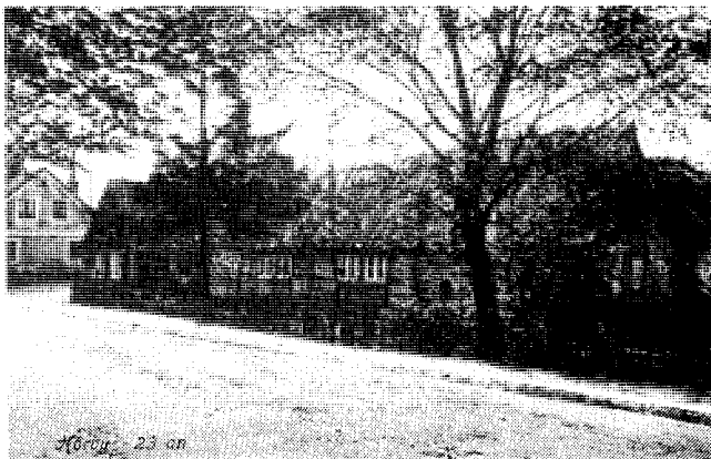
Gård nr 23 i hörnet Råbygatan—Södergatan (idag Ystadsvägen) några år före rivningen 1912.

Och vägen över ån som på 1880-talet hade det vackra namnet Södergatan bytte man av någon anledning till Ystadsvägen och Westergatan fick så småningom namnet Ringsjövägen.