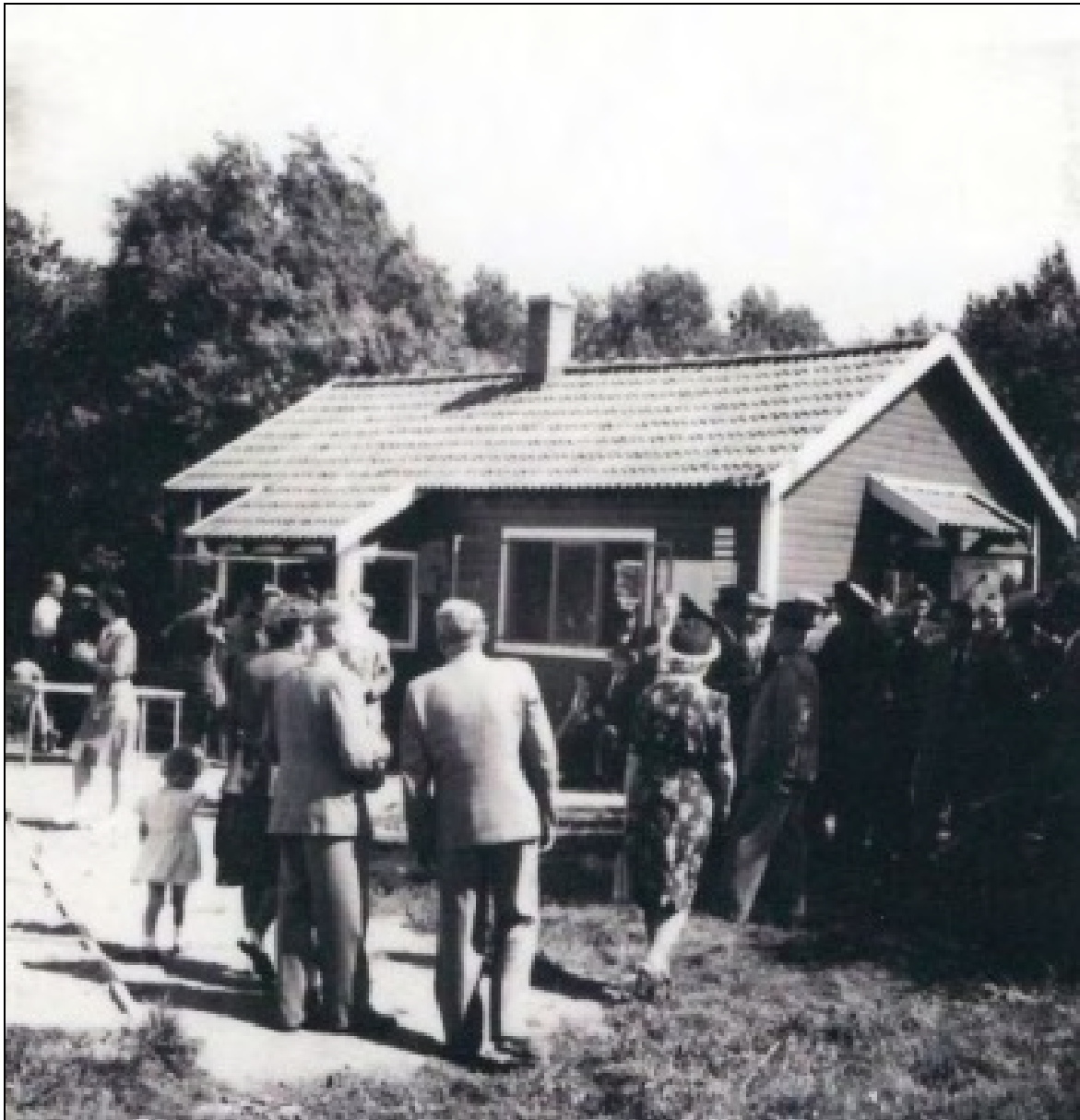
Klubbstugan vid skjutbanan i Slagtofta.