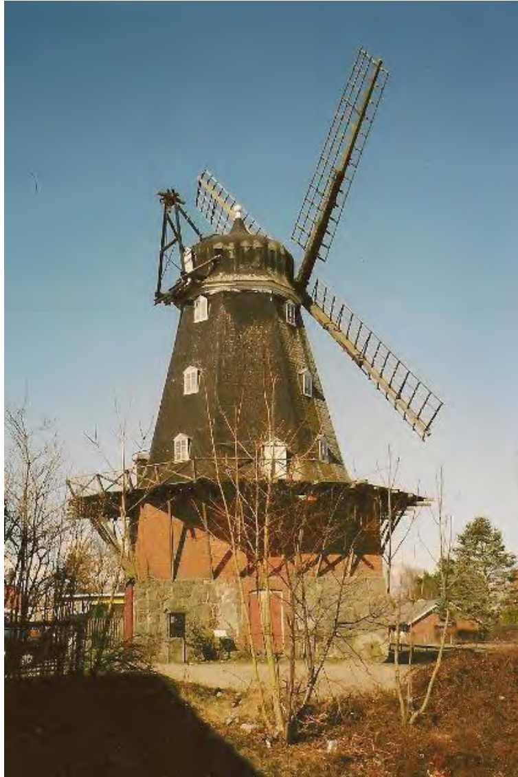
Sjöbo mölla. Stod tidigare i Omma och var den som kallades gamla möllan. Foto 2013.