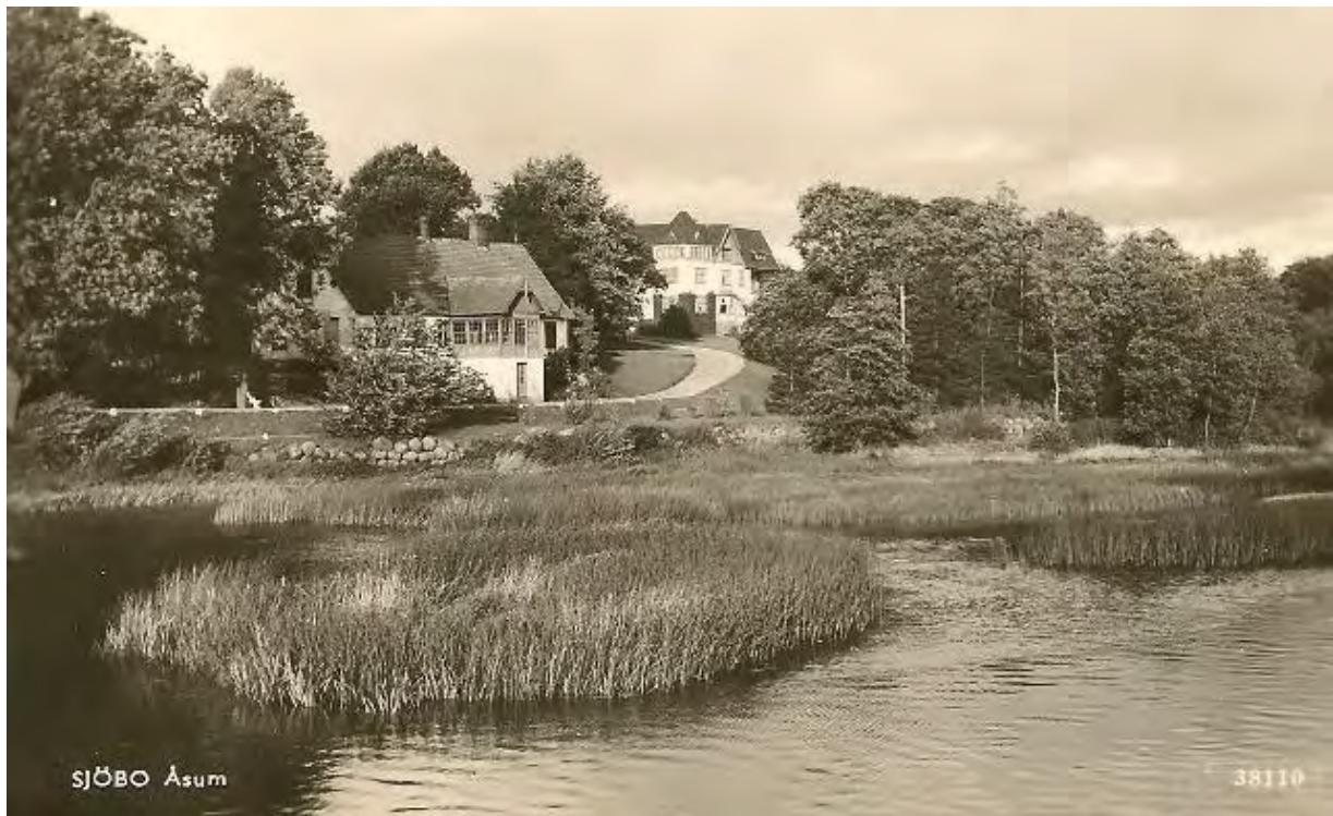
Södra Åsum. Vykort.