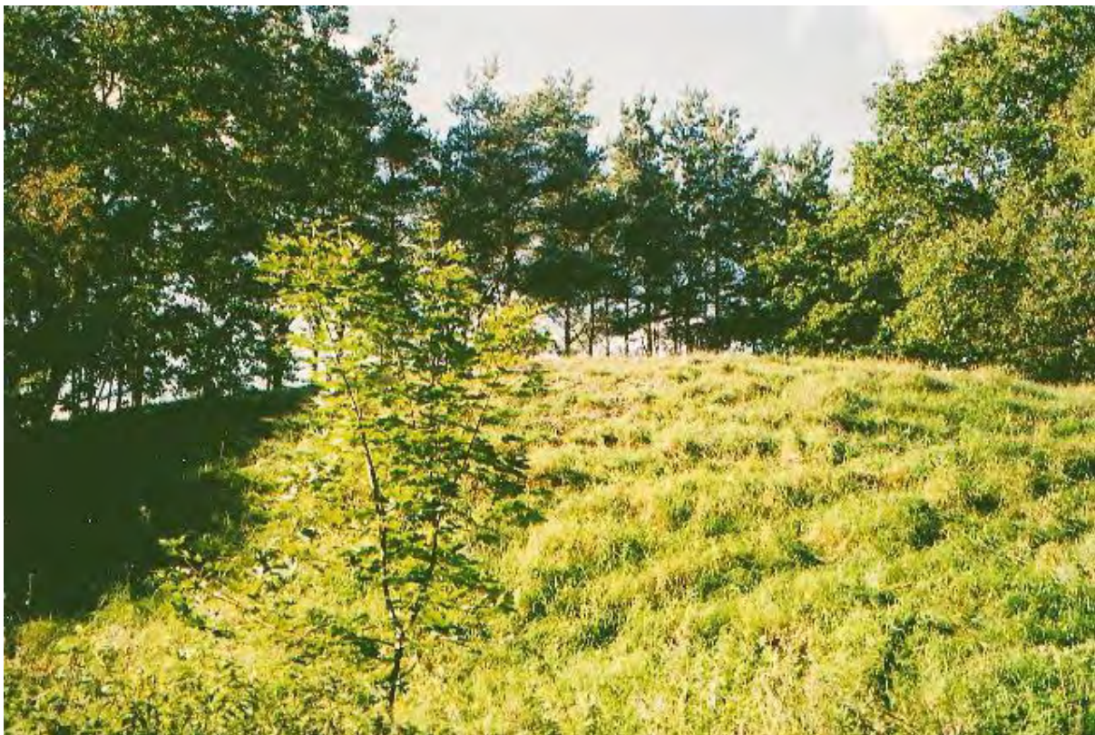
På kullen vid vägkorset i Omma stod den gamla möllan. Foto 2013.