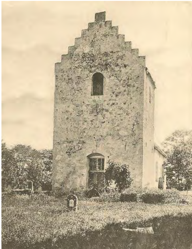
Södra Åsums kyrka övergiven och förfallen. Vykort från början av 1900-talet.