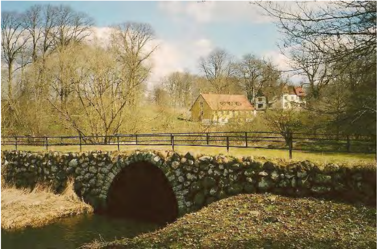
Gamla bron i Södra Åsum. I bakgrunden Södra Åsumgården. Foto 2013.

När kvarnen, som stod på en holme i ån, blev till åren ersattes den av en vattenkvarn i slutet av 1800-talet. Den nya kvarnen byggdes på en backe på Åsums gårds marker. Vattnet dämades upp och avleddes i en smal ränna där flödet fick en fallhöjd på 2 – 3 meter. Kvarnen var tre våningar hög och bestod av fyra valsstolar för malning av gröpe och mjöl till bakning.