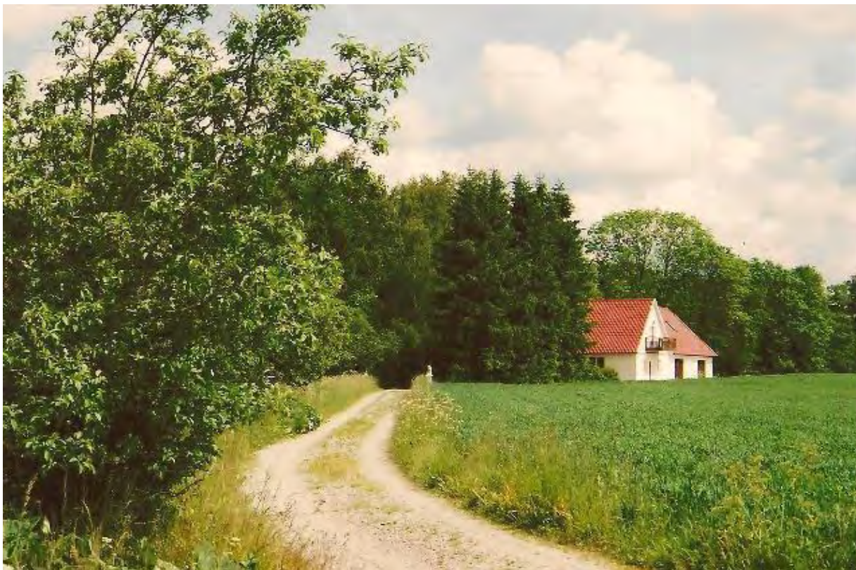
Omma Nymölla. Foto 2013.

Christian Ulmberg gifte om sig med Marna Trulsdotter 1761 i Ystad. 1763 nedkom hon med en dotter som fick namnet Kjersti.