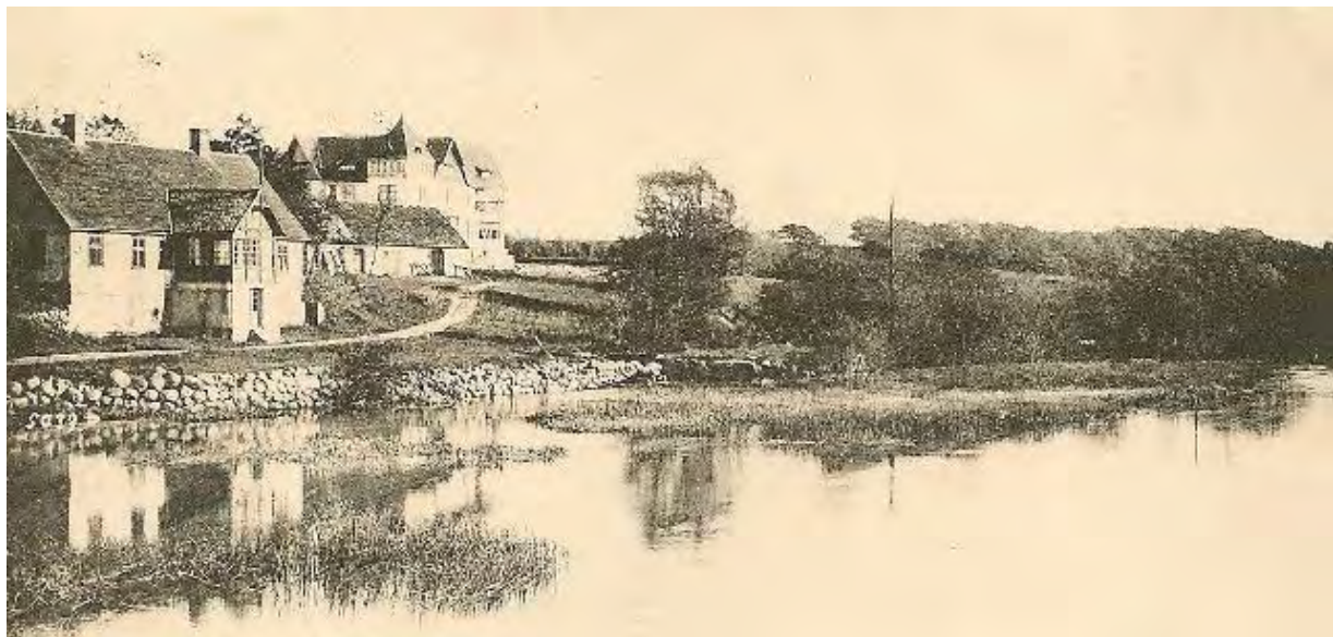
Södra Åsum. Vykort från början av 1900-talet. Stämplat 1905.