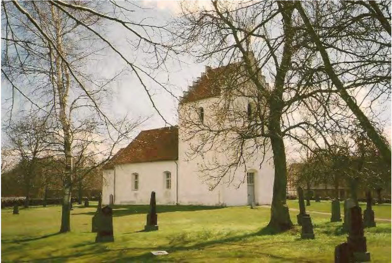
Södra Åsums gamla kyrka. Foto 2013.