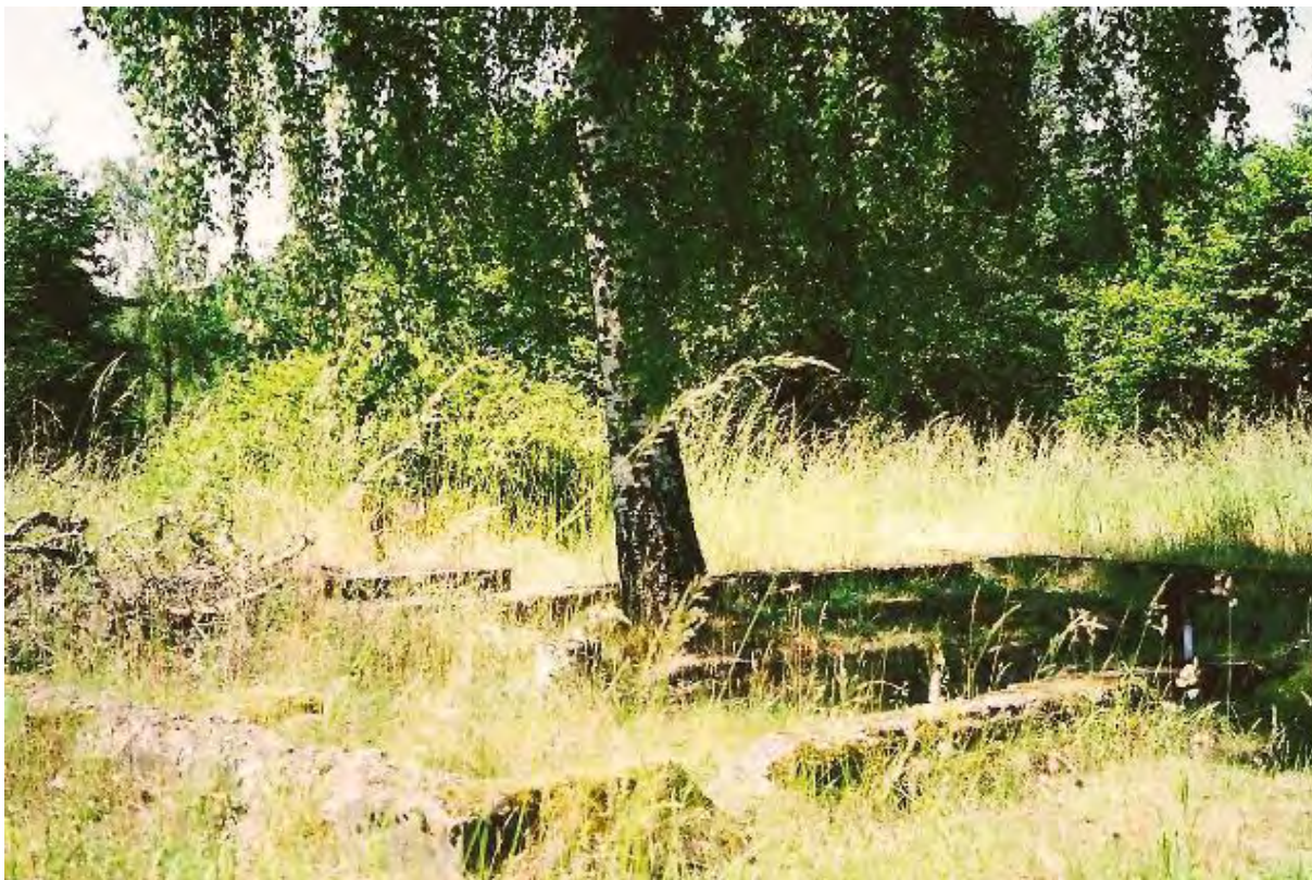
Mitt i den gamla ruinen efter Vasahus nr 3 växer en björk.