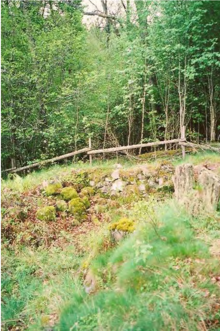
Ovan: Ingrävt i en backe låg det första Vasahuset. Nedan: Ett av de andra husen.