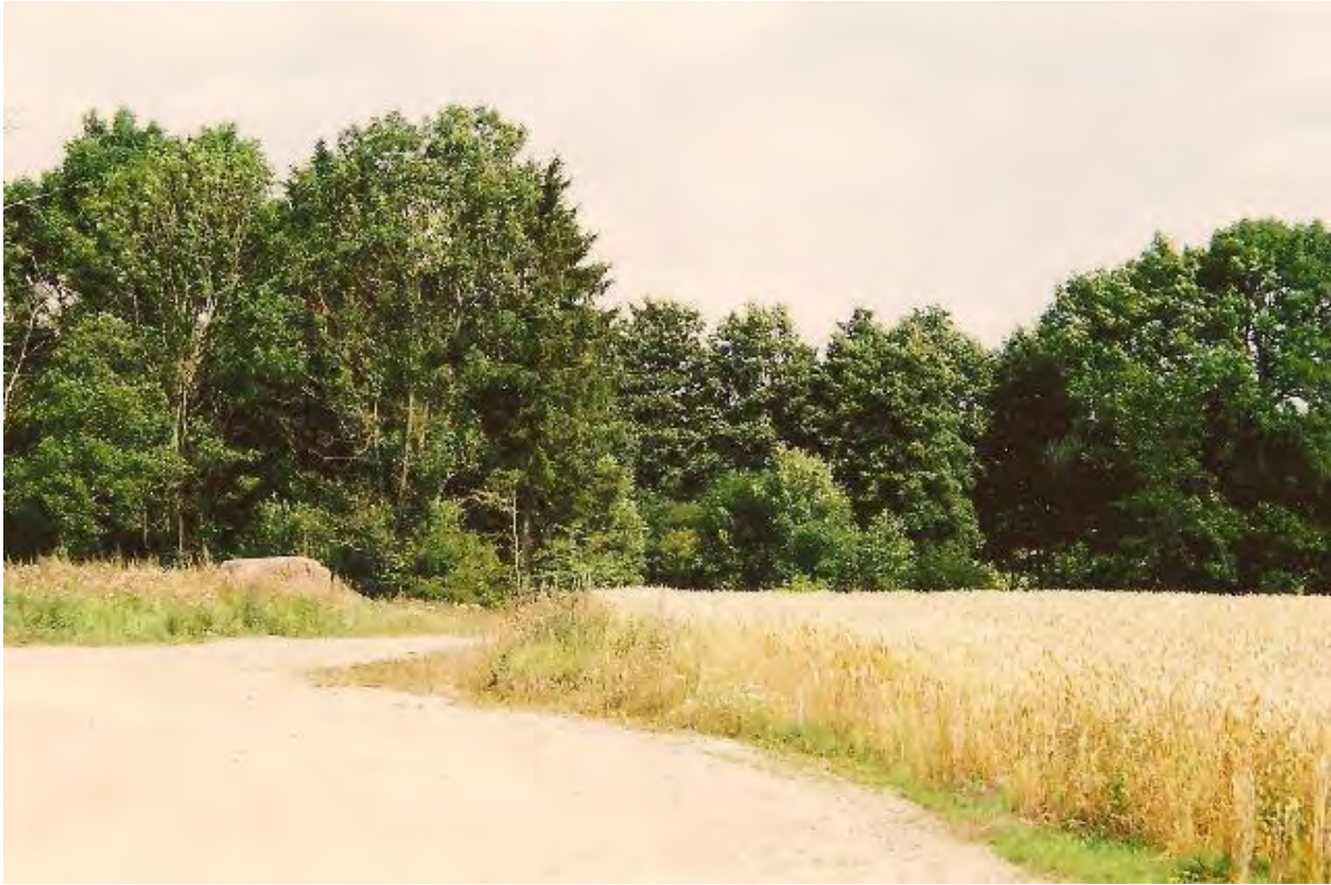
Vägen ner till kvarnen Gröntemölla. Idag finns inget spår kvar av möllan. Vattenmöllan hade ett par stenar och kunde mala året om.