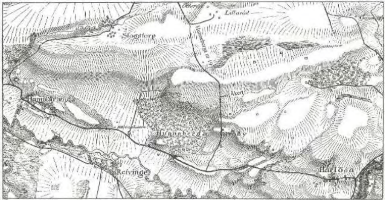
Skånska rekognosceringskartan från år 1812.