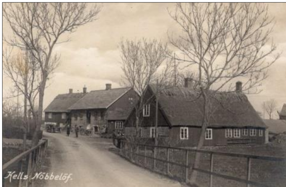
Vykort från tidigt 1900-tal.