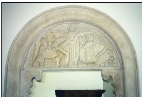
Den bevarade tympanon från den gamla kyrkan.

I byn har det funnits tre kyrkor. 1881 revs den medeltida tornlösa romanska absidkyrkan, daterad till omkring 1180-talet. 1800-talskyrkan uppfördes i gult tegel men revs på 1950-talet då man hade upptäckt att takstolen och tornets bjälklag var svårt angripna av husbock. Den tredje kyrkan invigdes den 13 december 1959.