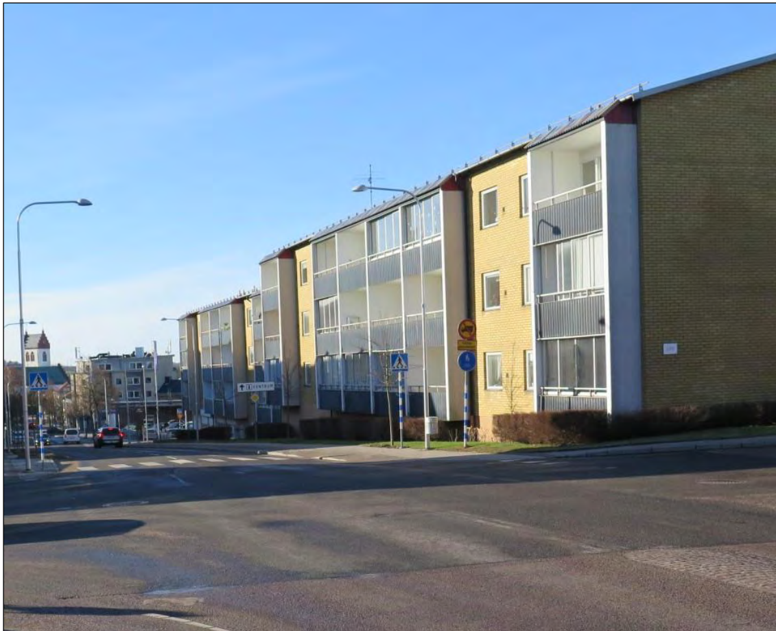
Tornabacken 2023 sedd från korsningen Kristianstadsvägen – Kungsgatan.