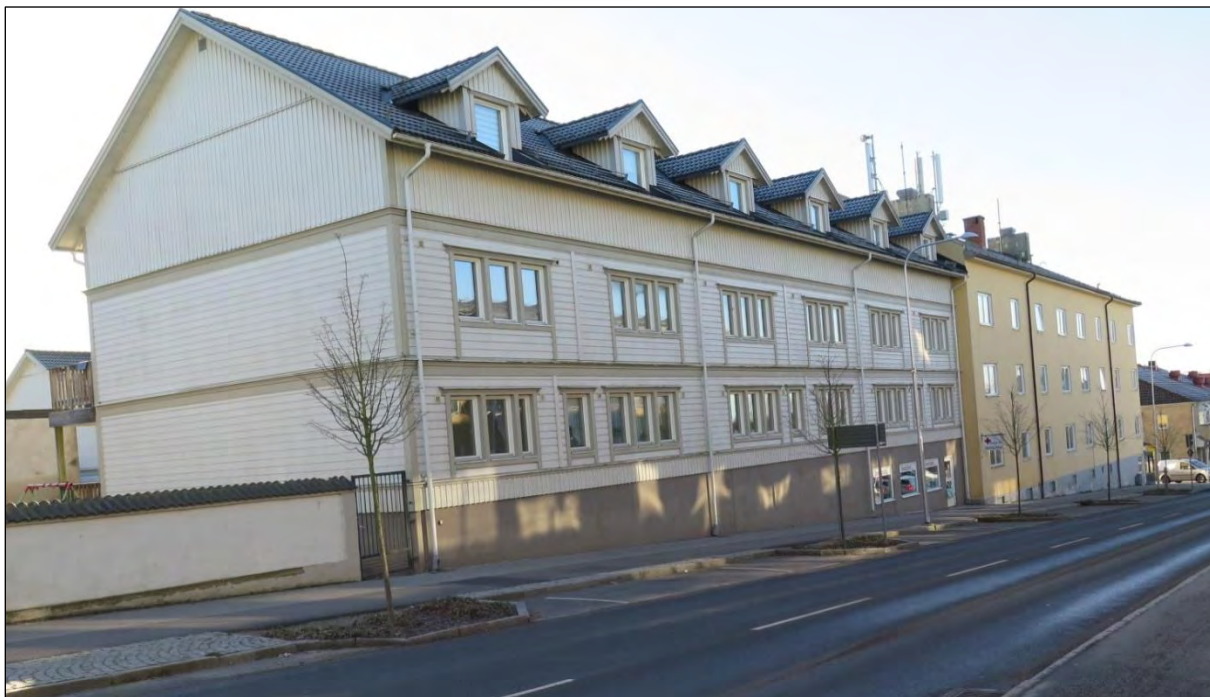
Även denna bild från Tornabacken 2023. Nya hus även på den andra sidan. Marken tillhörde gård nr 6 o 21.