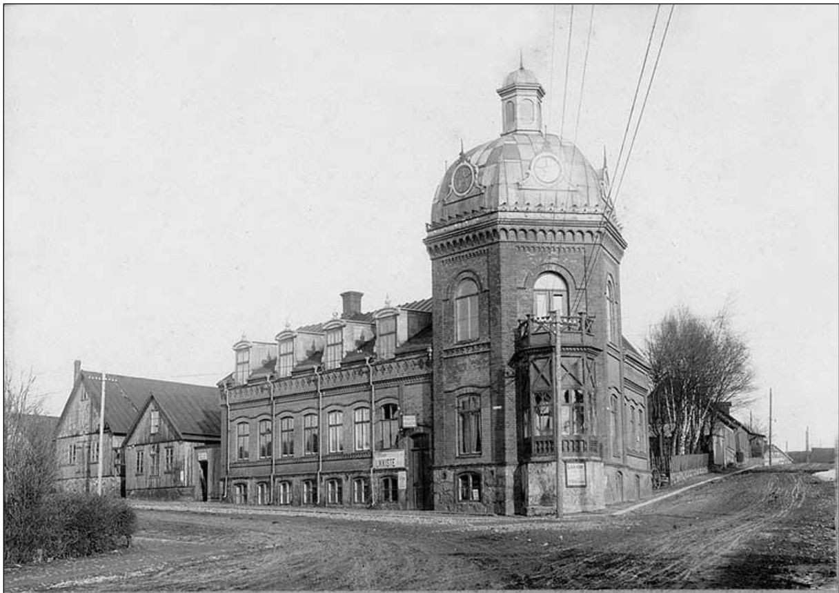
På översta våningen inrättades byns första telegrafstation. Ledningarna går ut till stora stolpar och löper längs gatan. Den första telefonlinjen gick härifrån och till Georgshill.