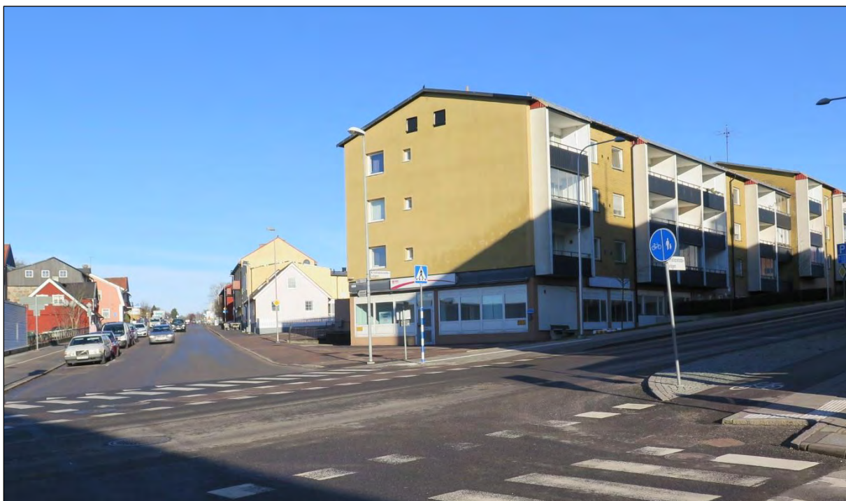
Korsningen Slagtoftagatan (Slagtoftavägen) och Östra Storgatan (Kristianstadsvägen). Framför det vita huset på höger sida mynnade Kärleksgatan ut.

Gatunamnen inom parentes är vad de heter idag. (2023)