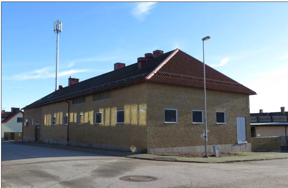
I hörnet Lilla Torggatan (Ernst Algrensgatan) och Lilla Nygatan (Bollhusgatan) köpte Kungliga Telegrafstyrelsen två tomter 1920 och byggde den nya telegrafstationen.