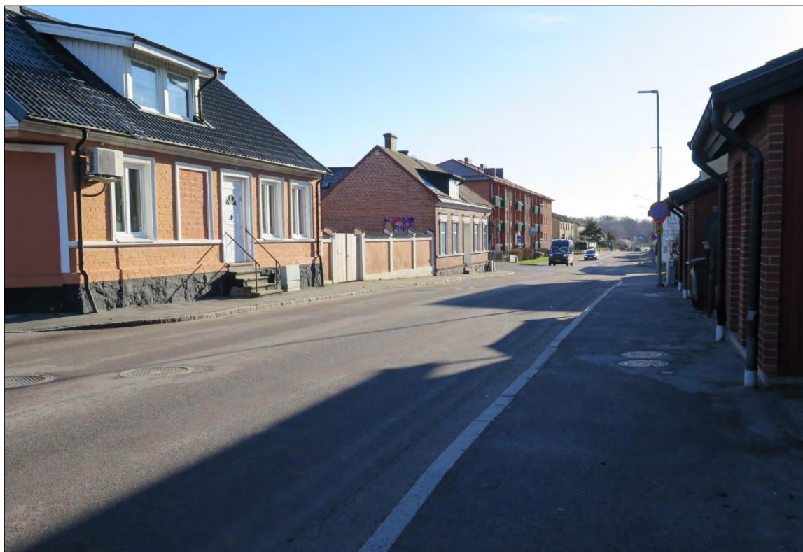
Före detta Järnvägsgatan. Numera Kungsgatan.