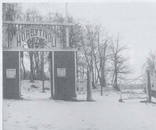
Entrén till Hörby Tivoli, senare Karnas Backe.