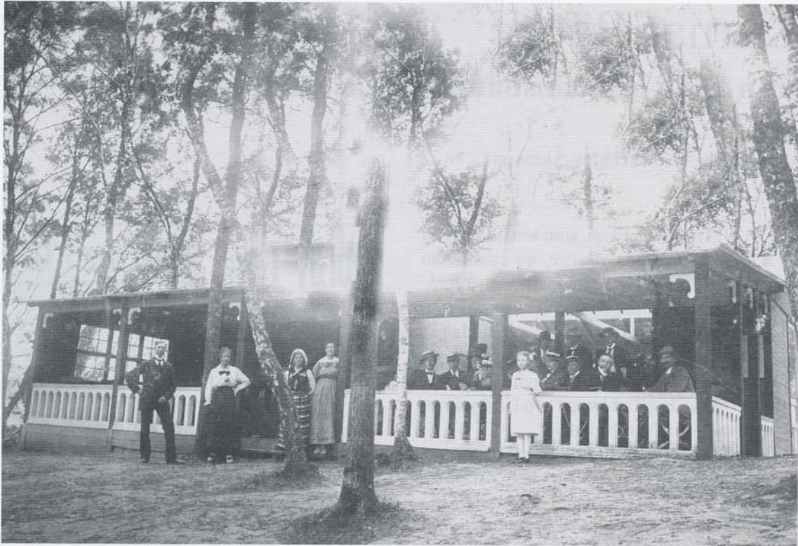
Hörby Tivoli, eller Karnas Backe, under sin glans dagar.

från tivoli och dansbana till rekreationsområde